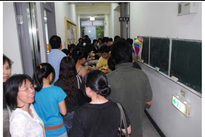
說明：導生餐會實況（203 室外走道）