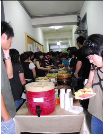
說明：導生餐會實況（203 室外走道）