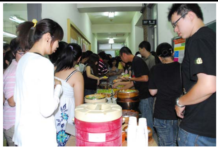
說明：導生餐會實況（203室外走道）