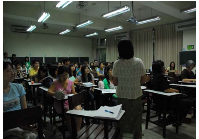
說明：符碧真老師就師資培育中心培育目標及核心能力進行補充說明-3