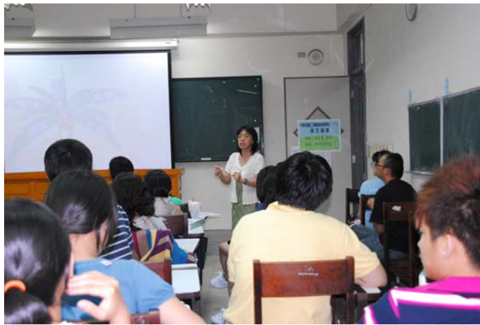
說明：符碧真老師就師資培育中心培育目標及核心能力進行補充說明-4