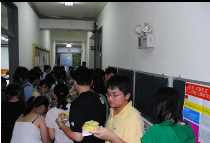
說明：導生餐會實況（203 室外走道）