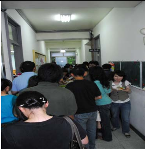
說明：導生餐會實況（203 室外走道）