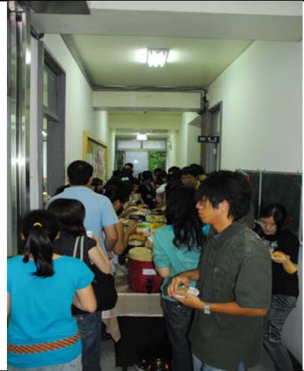
說明：導生餐會實況（203 室外走道）