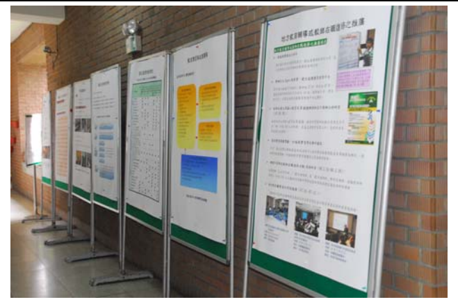
說明：辦學成果海報展示