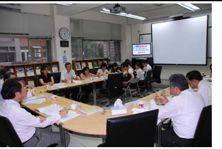
說明：綜合座談實況