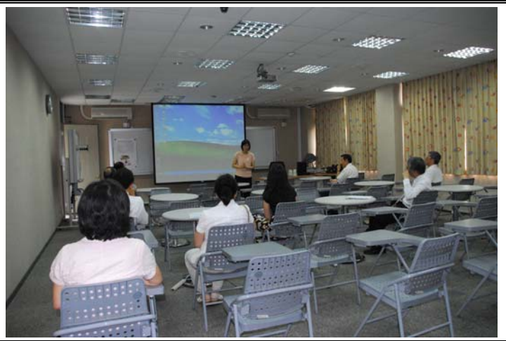
說明：評鑑委員蒞臨指導暨參觀教學設施