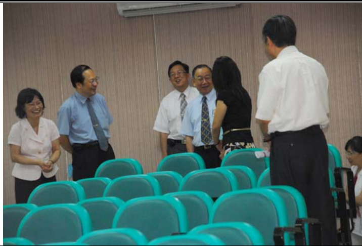
說明：評鑑委員蒞臨指導暨參觀教學設施