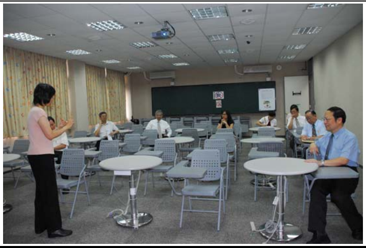
說明：評鑑委員蒞臨指導暨參觀教學設施