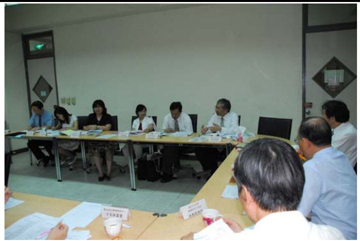
說明：綜合座談實況