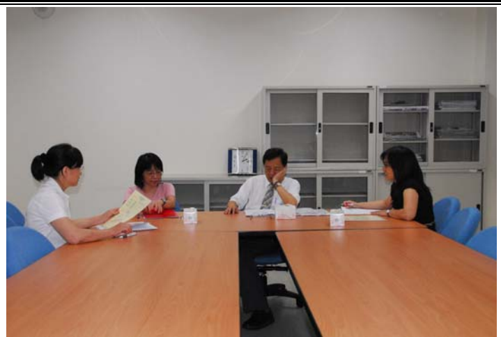
說明：評鑑委員與中心專任教師晤談實況