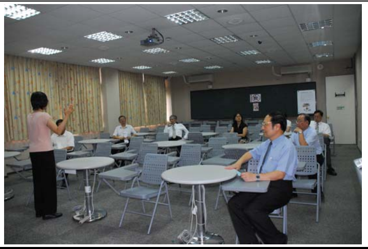
說明：評鑑委員蒞臨指導暨參觀教學設施