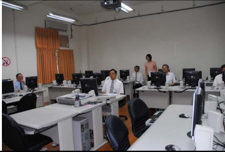
說明：評鑑委員蒞臨指導並參觀教學設施