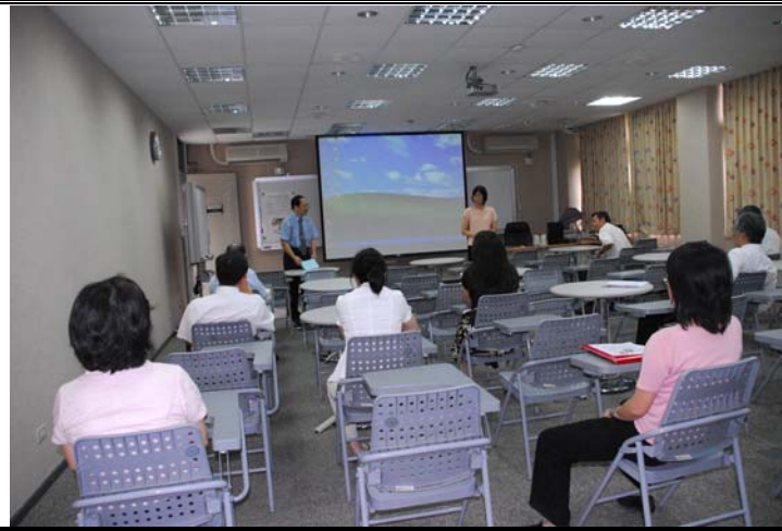
說明：評鑑委員蒞臨指導暨參觀教學設施