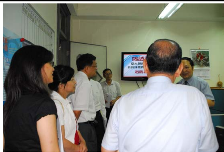
說明：評鑑委員蒞臨指導並參觀教學設施