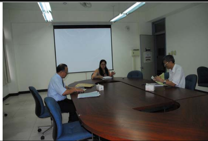
說明：評鑑委員與指導教授晤談實況