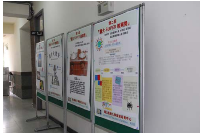
說明：辦學成果海報展示