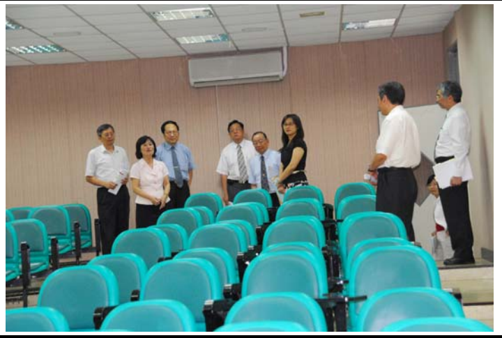
說明：評鑑委員蒞臨指導並參觀教學設施