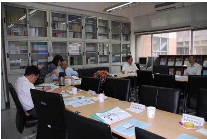
說明：評鑑委員蒞臨指導