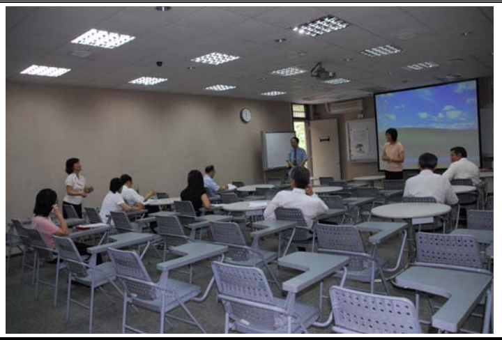
說明：評鑑委員蒞臨指導暨參觀教學設施