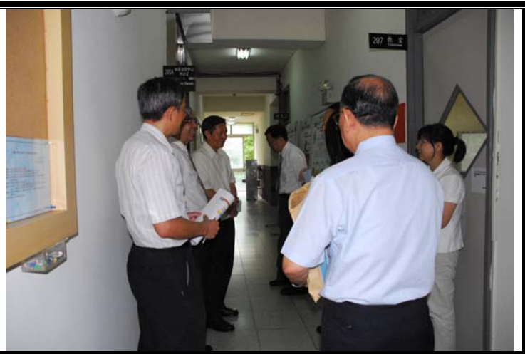
說明：評鑑委員蒞臨指導