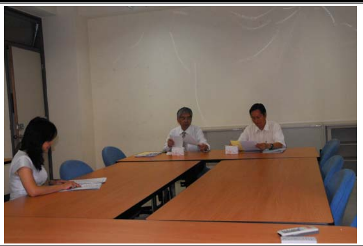
說明：評鑑委員與行政人員實況