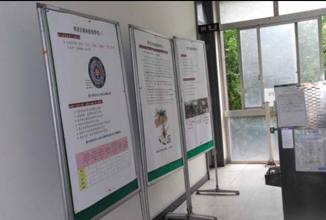
說明：辦學成果海報展示