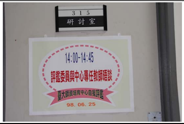
說明：實地訪評海報