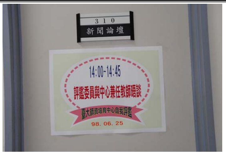
說明：實地訪評海報