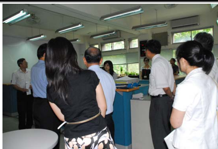
說明：評鑑委員蒞臨指導並參觀教學設施