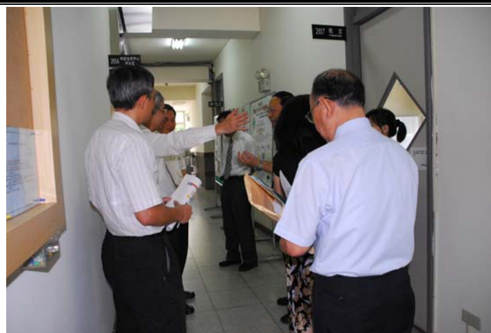
說明：評鑑委員蒞臨指導並參觀教學設施