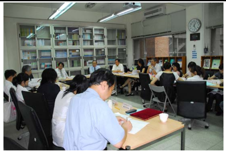
說明：綜合座談實況