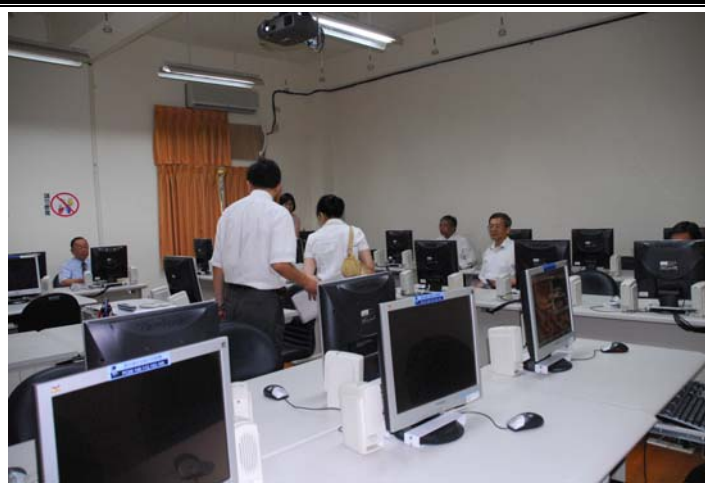
說明：評鑑委員蒞臨指導並參觀教學設施