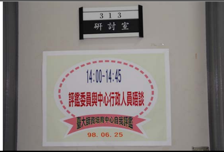
說明：實地訪評海報