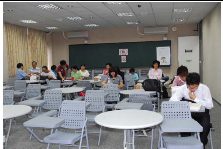
說明：晤談人員等待區