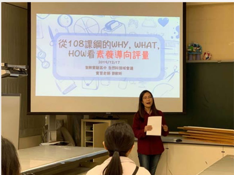
展現物理教學專業