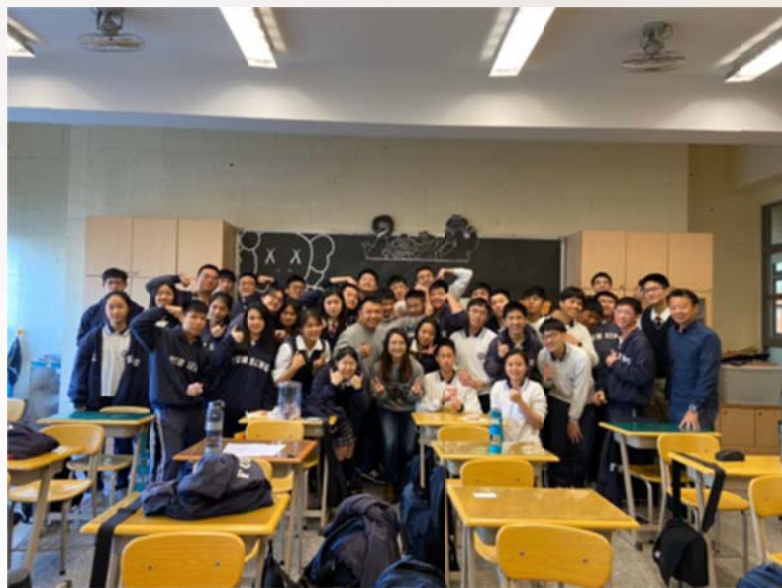
導師輔導用心陪伴